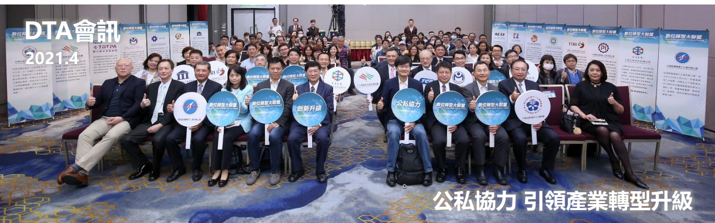
公私協力 引領產業轉型升級